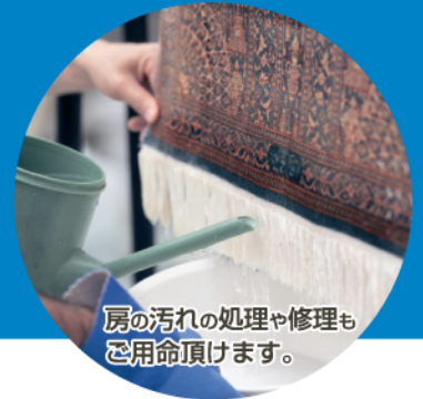
部屋の汚れの処理や修理も ご用命頂けます。